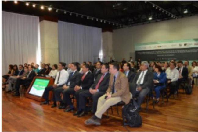
Asistencia a Conferencias