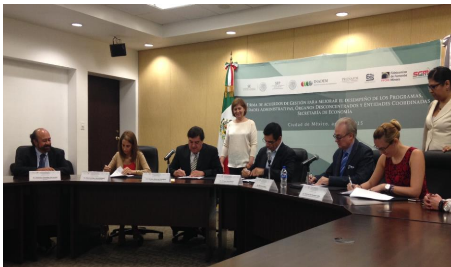
Firma de los Acuerdos de Gestión por parte de los Directores Generales del INADEM