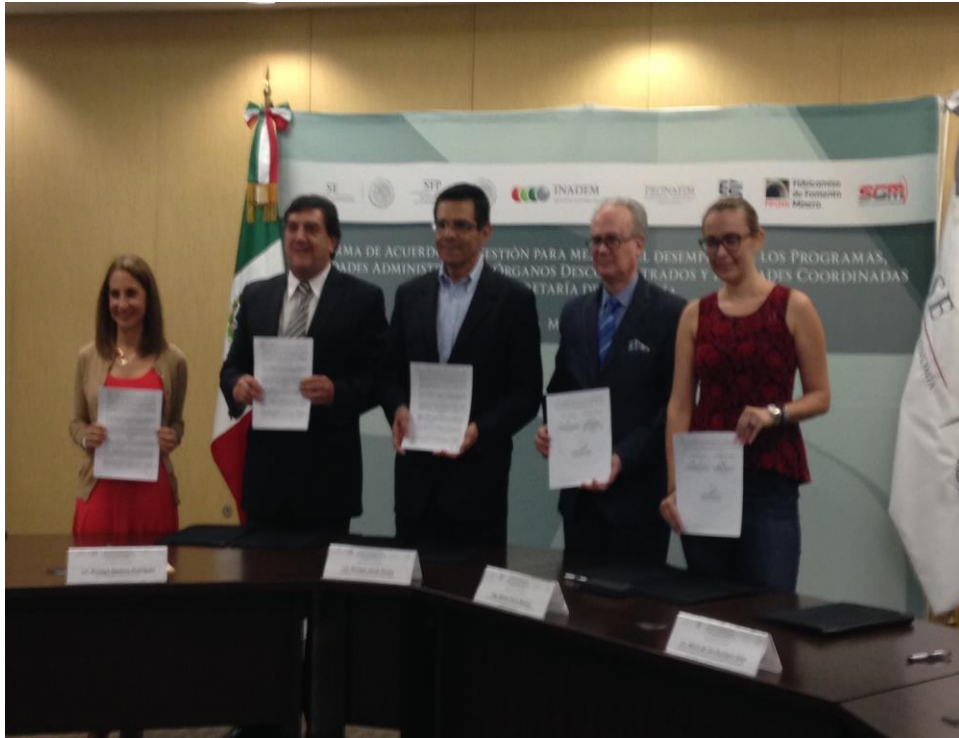
Firma de los Acuerdos de Gestión por parte de los Directores Generales del INADEM

Por otro lado, el INADEM continuará con la estrecha colaboración con los Organismos de la Sociedad Civil para analizar las áreas de oportunidad y acciones para mejorar el Fondo Nacional Emprendedor.