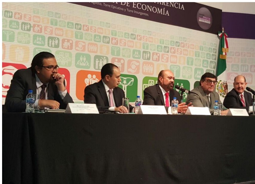
Conferencia “Transparencia e Innovación del Fondo Nacional Emprendedor”